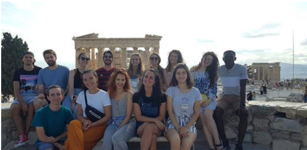
Hluti af hópnum á Acropolis hæð