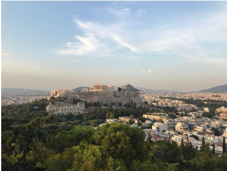
Útsýni yfir borgina og Acropolis hæð